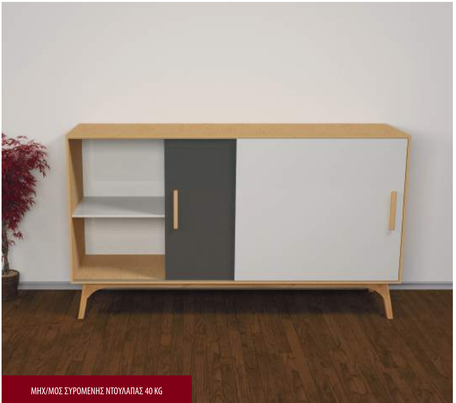
ΜΗΧ/ΜΟΣ ΣΥΡΟΜΕΝΗΣ ΝΤΟΥΛΑΠΑΣ 40 KG